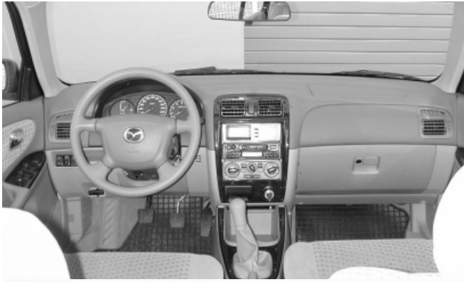
Übersichtlich, aber im Detail verbesserungswürdig: Das Armaturenbrett des 626.

Fahrt lenkt sehr ab. Das Handschuhfach ist nur bei eingeschalteter Zündung beleuchtet. Wird es geöffnet, klappt der Deckel auf die Knie des Beifahrers.