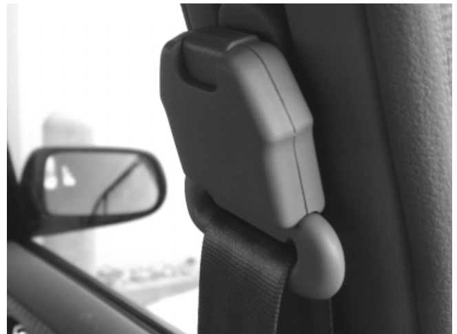
Der kantige Gurtbeschlag gefährdet die Köpfe der vorne Sitzenden bei einem Seitenaufprall.