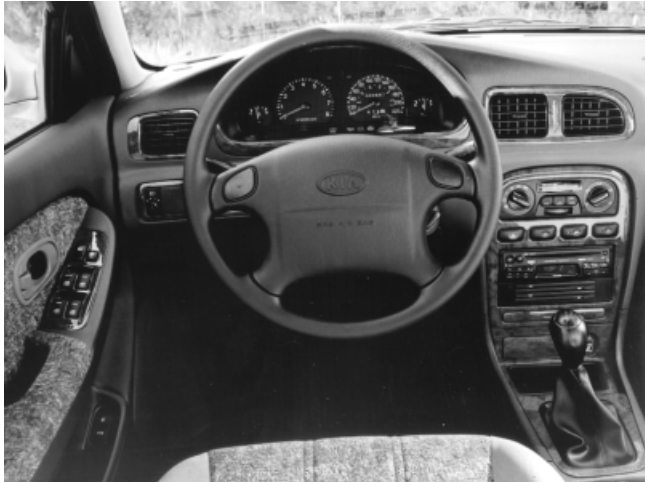
Bei der Funktionalität von Schalter und Kontrollleuchten gibt es noch Verbesserungspotential.

Zündung. Die Sitzeinsteller sind schwergängig. Vorne sind zu wenig Ablagen vorhanden; das Handschuhfach ist klein. Beim Ziehen des Handbremshebels stört der Ablagekasten. Die vorderen Türzuziehgriffe sind im Sitzen schwer zu erreichen, wenn die Türen vollständig geöffnet sind. Die weit hinten angelenkten Vordersitzgurte sind schwer zu erreichen. Zum Anlegen der Rücksitzgurte sind zwei Hände erforderlich, weil die Schösser nicht fixiert sind. Beim Öffnen des Handschuhfachs klappt der Deckel auf die Knie des Beifahrers.