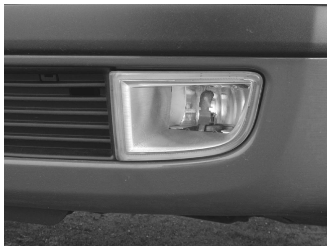
Die Nebelscheinwerfer sind bruchgefährdet untergebracht.

werden. Das Reserverad ist nur bei leerem Kofferraum zugänglich. In der Betriebsanleitung gibt es keinen Hinweis, wo die elektrischen Sicherungen untergebracht sind.