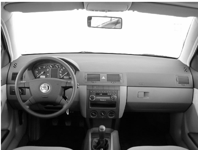
Klar gegliedert und funktionell präsentiert sich das Armaturenbrett des Fabia. Nur die Bedienung der Heizung ist unübersichtlich tief.