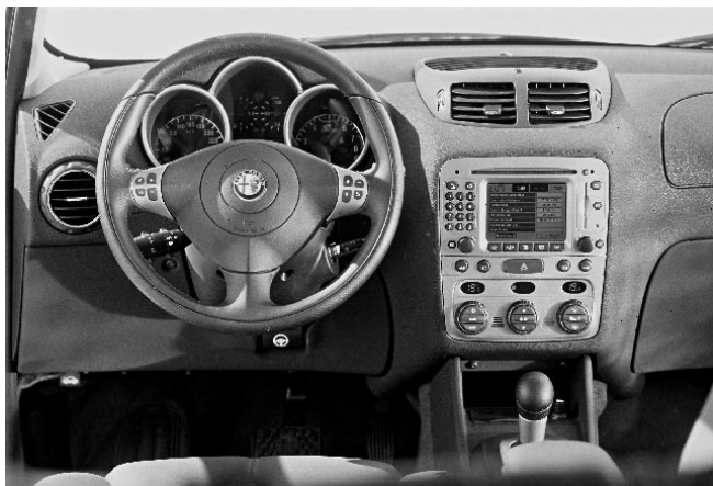
Bei der Bedienbarkeit musste manche Funktion der Form weichen.