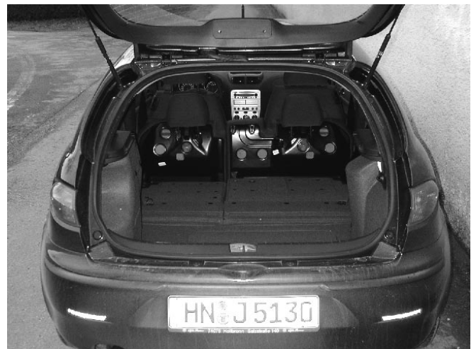
Klein und nur mäßig gut zu beladen: Der Kofferraum des Alfa 147.

Gemessen an der Fahrzeugklasse ist das Kofferraumvolumen mit 245 l noch akzeptabel.