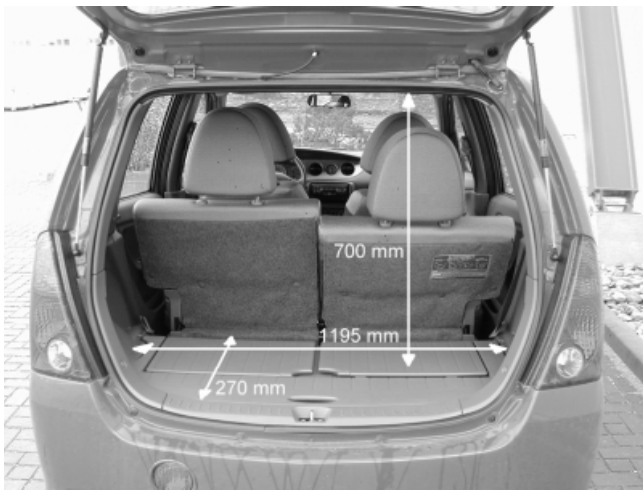
Mit nur 170l Fassungsvermögen ist der Kofferraum des YRV bei aufgestellten Rücksitzlehnen klein. Durch Umlegen der geteilten und längsverschiebbaren Rücksitzbank kann das Volumen jedoch auf bis zu 450 l erweitert werden.