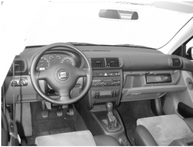
Das Armaturenbrett birgt keine Geheimnisse.

ein. Das Einstellen der Vordersitze in Höhe und Neigung erfolgt elektrisch mit griffgerechten Tasten. Das längs- und höhenstellbare Lenkrad lässt sich dem Fahrer optimal anpassen. Der Schalthebel liegt gut zur Hand, die wichtigsten Schalter befinden sich in der Nähe des Lenkrades.