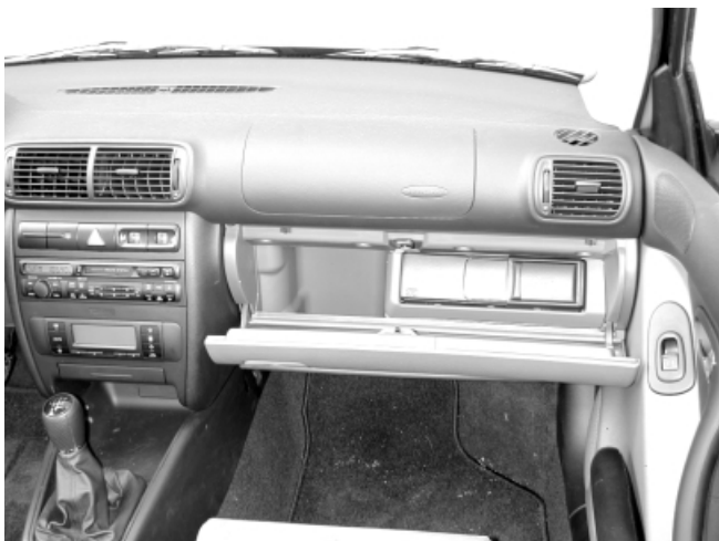
Das Platzangebot im Handschuhfach wird durch das Navigationssystem stark eingeschränkt.