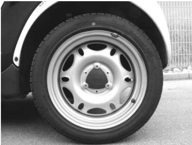
Die breiten Hinterräder sind mit drei Imbusschrauben befestigt