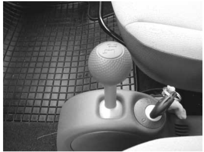
Nach kurzer Eingewöhnung lässt sich der Smart gut schalten