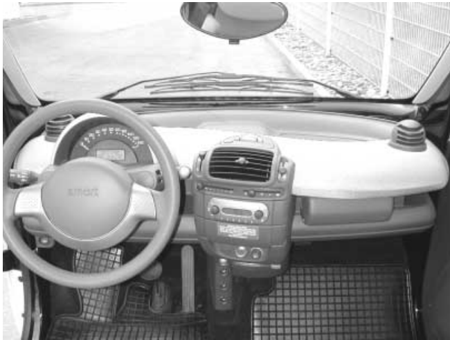
Das poppige Armaturenbrett lässt sich durch Drehzahlmesser und Zeituhr kombinieren

Es ist kein Handschuhfach vorhanden. Dem Tacho fehlen die Gangbereiche, der Drehzahlmesser ist nicht Serie.