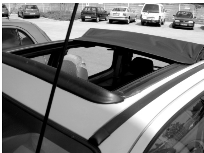
Das große, aufpreispflichtige Faltschiebedach lässt genügend Frischluft und Sonne in den Innenraum.