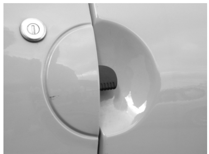
Mit diesen Türgriffen lassen sich verklemmte Türen schlecht öffnen

In punkto Außengestaltung ist der Twingo nur Mittelmaß. Die Karosserie ist im Bugbereich glatt, die Wischer stehen jedoch vor (Verletzungsrisiko).