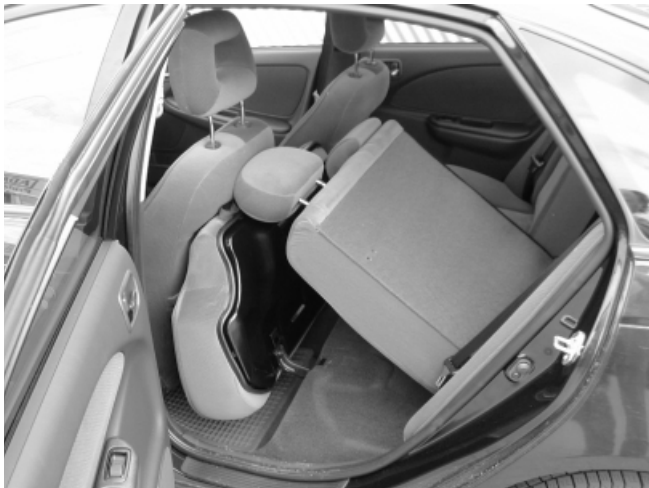
Nicht ganz einfach gestaltet sich das Umlegen der Rücksitzlehnen

abgezogen und die vorderen Sitze vorgeschoben werden. Für kleinere Utensilien fehlen Ablagen. Eine Durchladeluke bzw. ein Skisack ist nicht lieferbar.