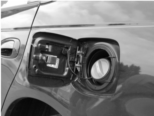
Der Tankstutzen befindet sich auf der dem Verkehr zugewandten linken Fahrzeugseite.