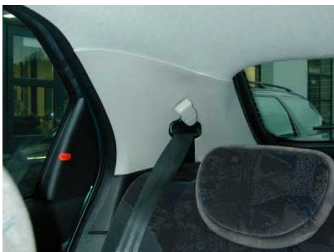
Die breiten C-Säulen beeinträchtigen die Sicht nach hinten.