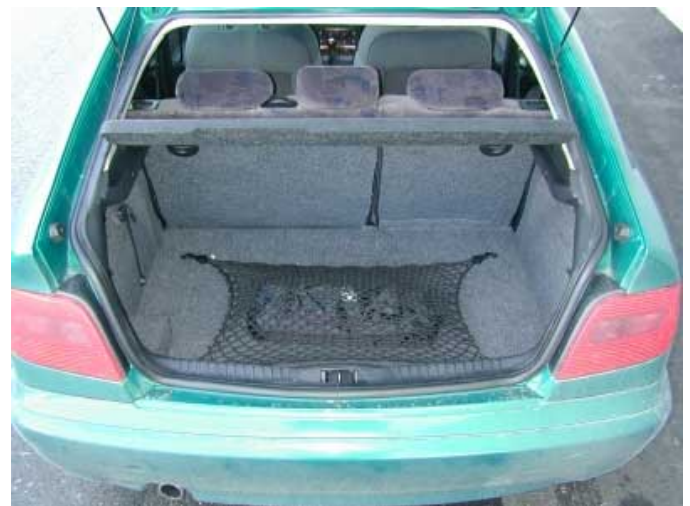
Groß und gut zugänglich präsentiert sich der Kofferraum des Xsara.

Der Kofferraum ist durchschnittlich groß. Er fasst 350 l. Er kann durch Vorklappen der Rücksitzbank auf 720 l vergrößert werden (bis Fensterunterkante gemessen).