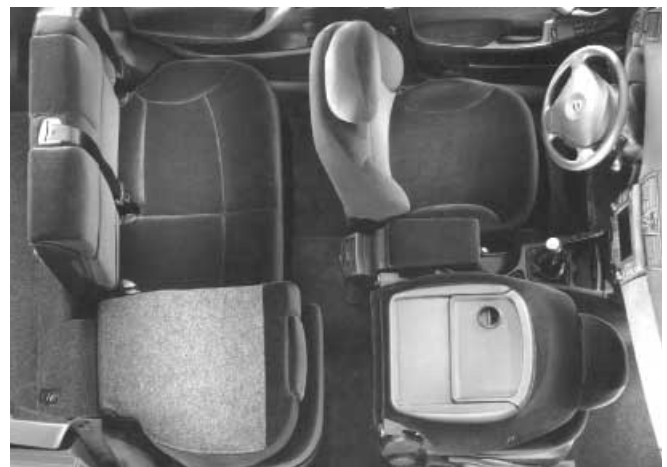
Sehr praktisch: Die Rücksitzbank lässt sich nicht nur klappen, sondern auch verschieben. Die Beifahrerlehne kann vorgeklappt werden.

-Die Türschweller sind überwiegend lackiert und können