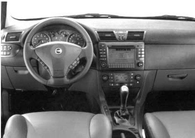
Das Armaturenbrett wirkt aufgeräumt. Die hochwertigen Kunststoffe fühlen sich angenehm an.