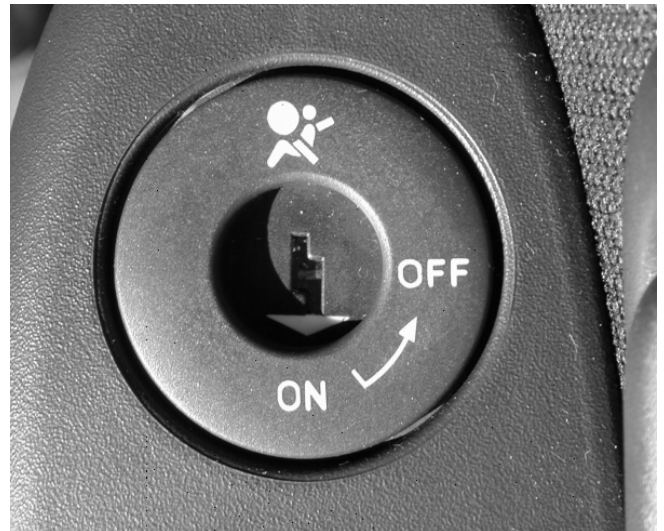
Zur Verwendung rückwärtsgerichteter Kinderrückhaltesysteme kann der Beifahrerairbag deaktiviert werden