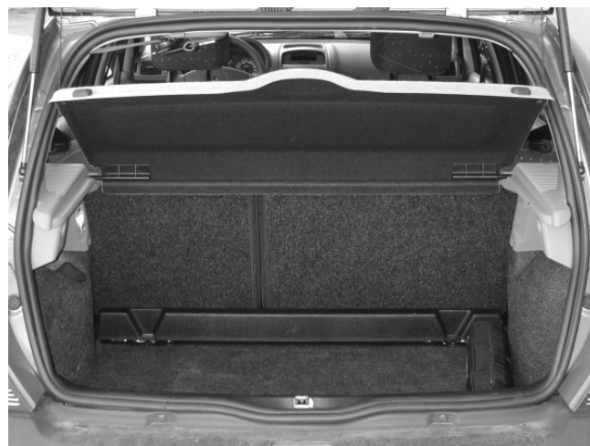
Das Kofferraumvolumen bewegt sich auf klassenüblichen Niveau.

Gemessen an der Fahrzeugklasse ist das Kofferraumvolumen zufriedenstellend (270 l). Wenn man die Rücksitzbank vor-klappt, stehen 540 l zur Verfügung (gemessen bis zur Fensterunterkante).