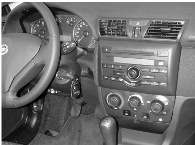
Bis auf die zu tief angeordneten, schlecht beleuchteten Bedienelemente für Heizung und Lüftung ist der Stilo gut zu bedienen

+ Der Stilo ist sehr leicht zu bedienen. Die großen, klar gezeichneten Rundinstrumente sind problemlos abzulesen. Die wichtigsten Funktionen befinden sich gut zugänglich in Lenksäulenhebeln. Der Ganghebel liegt gut zur Hand, die Schalter für die Vorderfenster und Außenspiegel sind leicht zu bedienen und beleuchtet. Für Stadtfahrten und Parkmanöver lässt sich die Lenkung auf "City" umstellen, sie ist dann besonders leichtgängig. Es gibt große, praktische Ablagen und Flaschenhalter, das obere Handschuhfach wird durch die Klimaanlage gekühlt. Sensoren (Aufpreis) sorgen für das automatische Einschalten der Scheibenwischer bei Regen und der Scheinwerfer bei Dunkelheit. Der Innenraum wird hell ausgeleuchtet, ergänzt durch Leselampen vorne. – Der Hebel zur Längsverstellung der Vordersitze ist schlecht zu erreichen, weil er zu tief am Boden sitzt. Die Wischer sprechen bei Betätigung der Wisch-/Wasch-Automatik verzögert an. Die Heizungs- und Lüftungsbedienung ist unübersichtlich, weil sie zu weit unten angeordnet ist; besonders bei Dunkelheit ist die Beleuchtung zu schwach. Die hinteren Seitenfenster lassen sich nicht öffnen. Zum Anlegen der Rücksitzgurte sind zwei Hände erforderlich, weil die Schösser nicht fixiert sind.