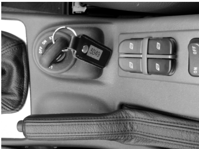
Wie bei allen Saab-Modellen befindet sich das Zündschloß auf der Mittelkonsole.

– Die Schalter für die Fensterheber sind zwischen den Vordersitzen unpraktisch angeordnet. Im Bereich der Mittelkonsole sind zu viele gleichförmige Schalter untergebracht; dadurch hat man Schwierigkeiten beim Finden. Es fehlt eine Fahrlichtkontrolle.