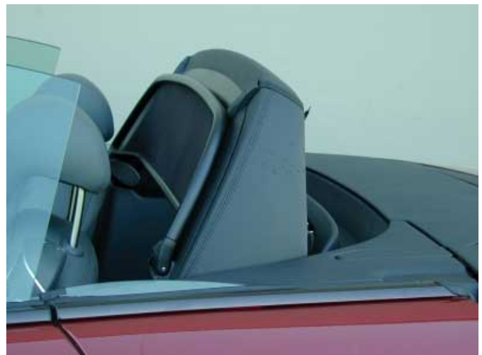
Bei Gefahr schnell ein massiver Überrollbügel hinter den Köpfen der Insassen nach oben.