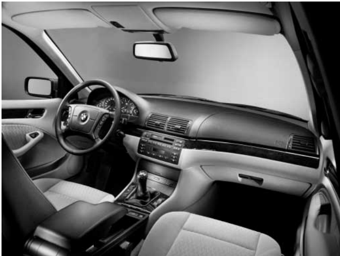
Bei der Bedienung und Instrumentierung gibt es kaum etwas auszusetzen.