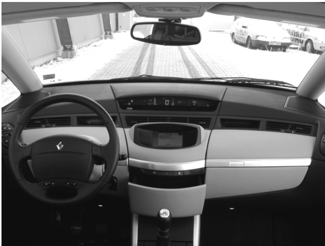
Avangardistisch wie das gesamte Fahrzeug präsentiert sich auch das Armaturenbrett des Avantime