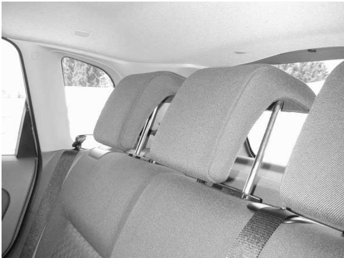
Die Rücksitzkopfstützen bieten Personen bis 1,60 m Größe guten Schutz.