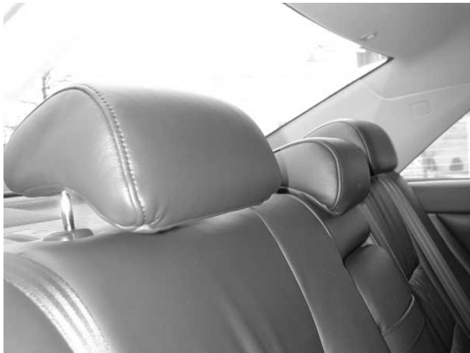
Es sind zwar drei versenkbare Kopfstützen für die hinteren Sitzplätze vorhanden, jedoch bieten sie nur Personen bis zu einer Größe von 1,55 m ausreichenden Schutz.