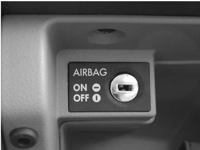
Per Zündschlüssel sind die Airbags auf der Beifahrerseite zu deaktivieren. Damit können auch auf diesem Sitzplatz rückwärts gerichtete Kinderrückhaltesysteme verwendet werden.