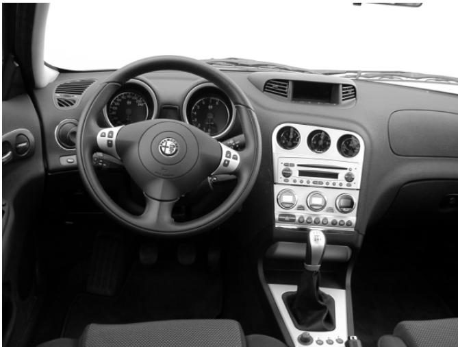
Die Gestaltung des Armaturenbretts verströmt durchaus ein sportliches Flair.