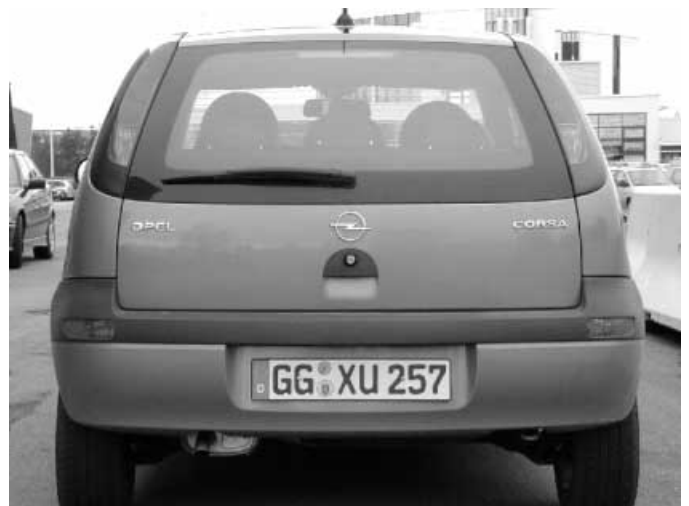
Nicht nur ein Design-Merkmal: Die hochgesetzten Rückleuchten am Heck des Corsa werden vom nachfolgenden Verkehr besser wahrgenommen.