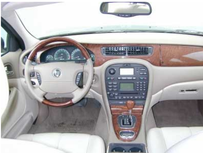
Das Interieur des S-Type beweist, dass Funktionalität und Stil sich nicht gegenseitig ausschließen.