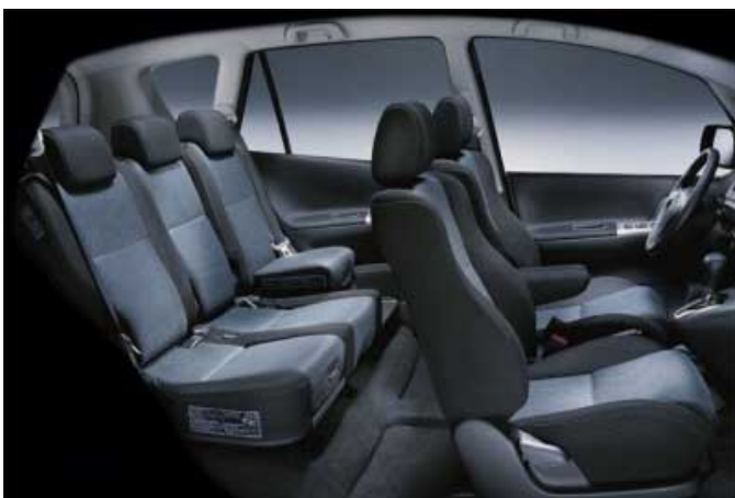
Für diese Fahrzeugklasse herrscht im Innenraum ein großzügiges Platzangebot. Selbst bis zu 1,85 m große Personen können hinten bequem sitzen.