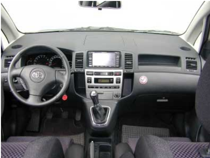
Die Bedienung gibt dem Fahrer keine Rätsel auf. Im Gegensatz zu vielen anderen Fahrzeugen sind auch die Bedienelemente für die Heizung und Lüftung gut zu erreichen.