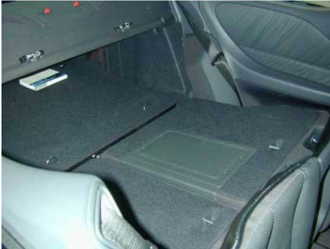
Die asymmetrisch umklappbaren Rücksitzlehnen ermöglichen das Verstauen längerer Gegenstände.