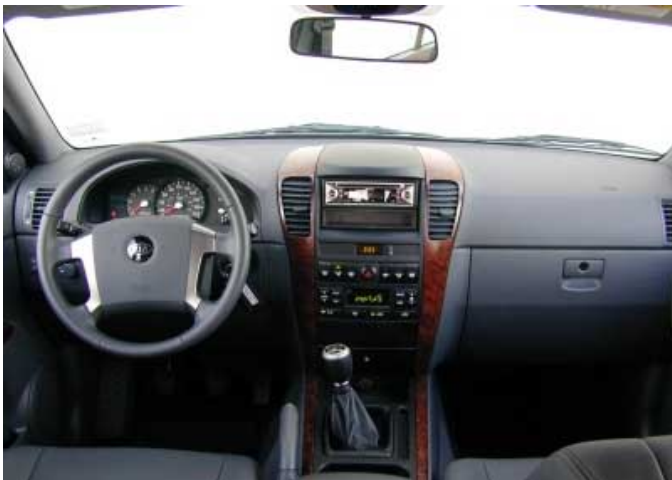
Neben der üblichen, guten Funktionalität überzeugt der Sorento durch ein gelungenes Innenraumdesign und angenehme Materialauswahl.