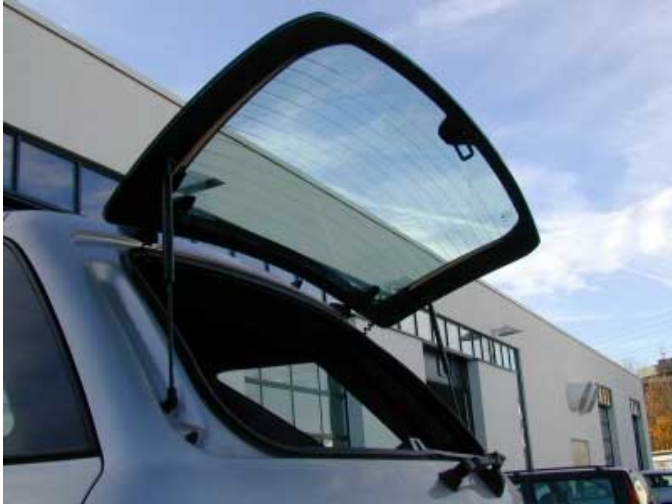
Ob hier BMW Pate gestanden hat? Auf jeden Fall erleichtert die separat zu öffnende Heckscheibe das Beladen.

Gurtbänder eingeklemmt und beschädigt werden. Weder eine Durchladeluke noch ein Skisack sind erhältlich.