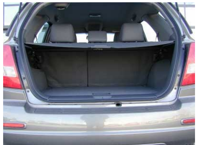
Mit 380l Volumen ist der Kofferraum nicht allzu groß.