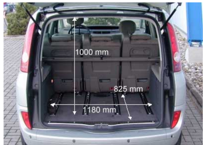
Mit 550l Volumen besitzt der neue Espace einen respektablen Kofferraum, muß sich jedoch in dieser Kategorie dem neuen Eurovan (z.B. Peugeot 807) geschlagen geben.