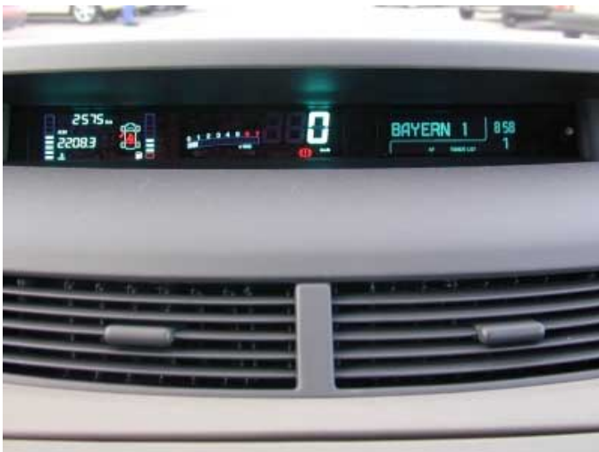
Die in der Mitte des Armaturenbretts gelegenen Instrumente befinden sich nicht nur außerhalb des direkten Sichtbereichs des Fahrers, sondern sind zudem auch schlecht ablesbar.