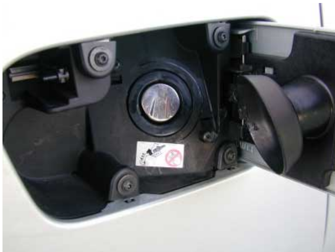
Vergessene Tankdeckel gehören der Vergangenheit an.