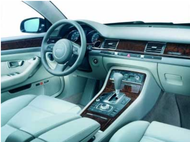
Bis auf wenige Ausnahmen geriet die Bedienbarkeit des A8 vorbildlich.