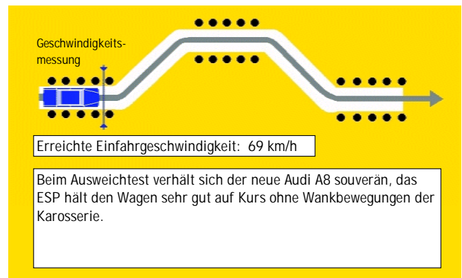
Ausweichen vor Hindernis (Elchtest).