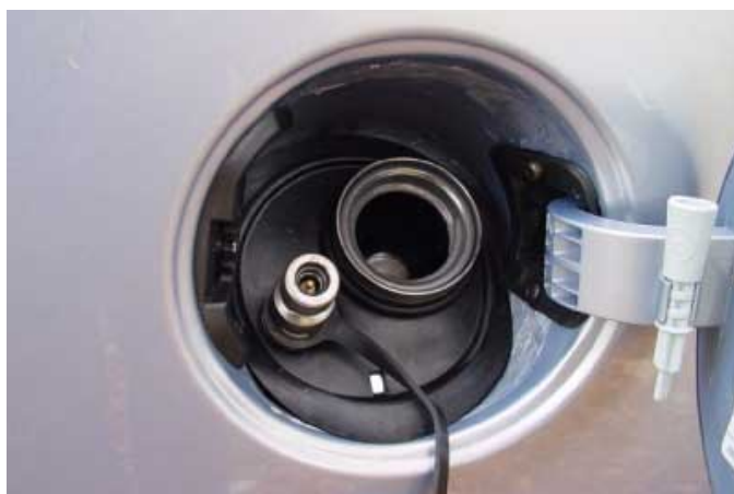
Der Einfüllstutzen für den Gastank ist unter der Tankklappe positioniert.