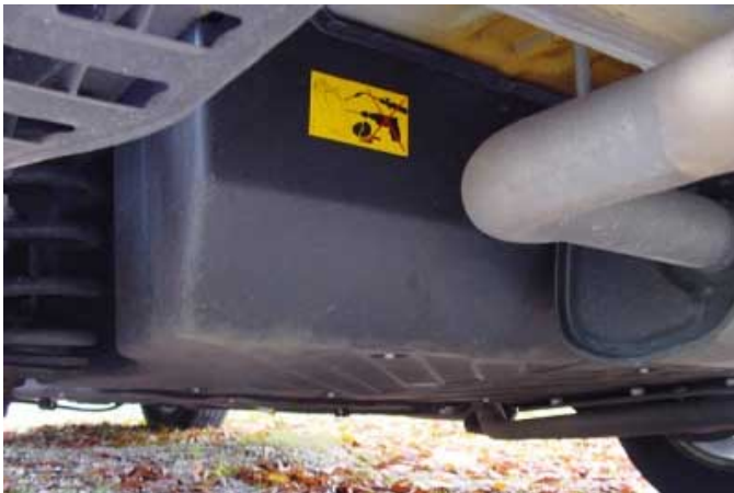
Der Erdgastank ist platzsparend unter dem Fahrzeugboden eingebaut. Damit wird der Innenraum nicht eingeschränkt.