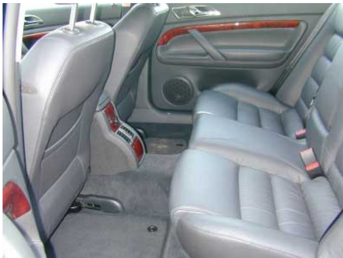
Der Knieraum der Fondpassagiere ist sehr üppig bemessen. In dieser Fahrzeugklasse ist er damit fast konkurrenzlos.

+ Die für zwei Insassen ausgeformte Rücksitzbank bietet viel Platz. Selbst wenn die Vordersitze weit zurückgeschoben sind, ist die Kniefreiheit extrem groß. Nur Personen, die größer als 1,85 m sind, stoßen mit dem Kopf am Dach an.