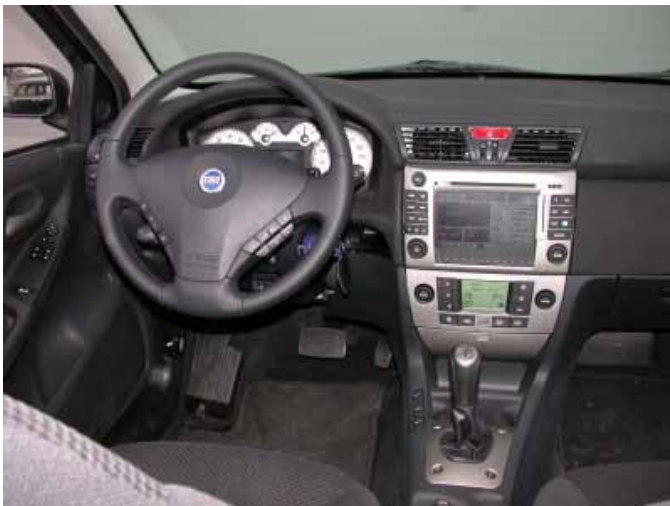
Außer den Bedienelementen für Heizung und Lüftung ist der Abarth leicht zu bedienen.