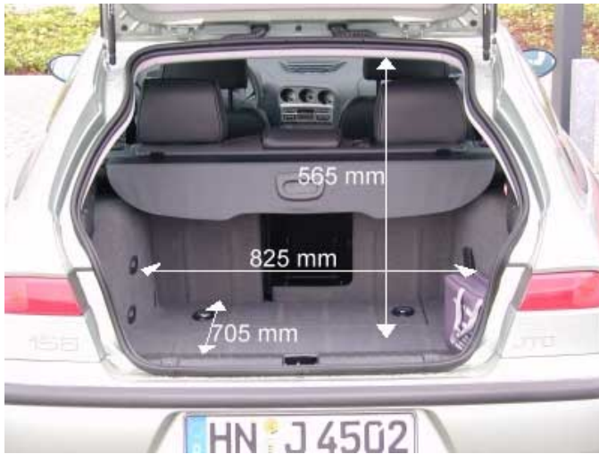
Mit 350 l Volumen ist der Kofferraum des Sportwagon ausreichend groß.