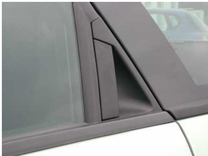
Die Öffner der hinteren Türen verbergen sich im Türrahmen.