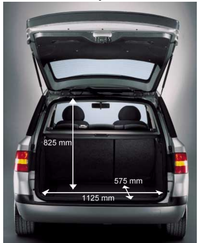
Mit 440 l Volumen ist der Kofferraum des Multiwagon zwar groß, reicht aber nicht an die der Klassenkonkurrenten heran.