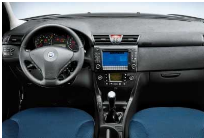
Leichte Bedienung und sinnvolle Detaillösungen kennzeichnen den Multiwagon.