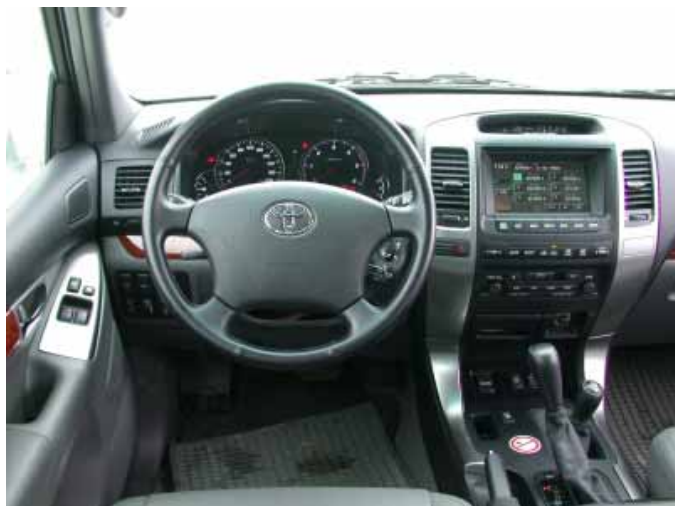
Sowohl die äußere Erscheinung als auch der Fahrerplatz erinnern nur noch wenig an den rustikalen Geländewagen früherer Tage.