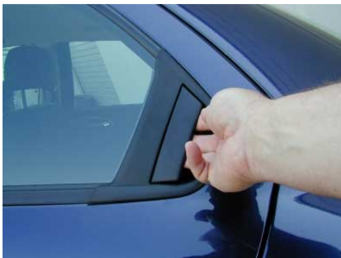
Die Öffner der hinteren Türen verstecken sich im Fensterrahmen.