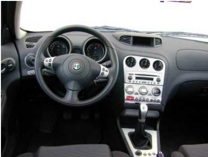
Die Gestaltung des Armaturenbretts verstört durchaus ein sportliches Flair.