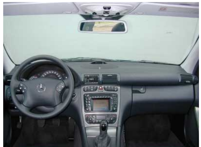
Am Armaturenbrett gibt es wenig zu bemängeln.