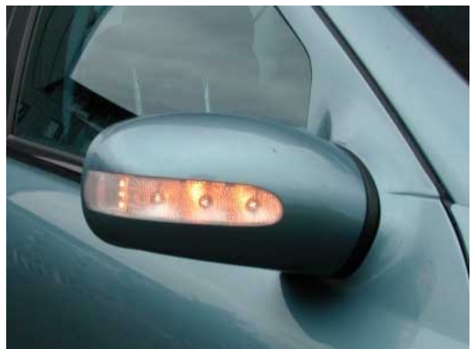
Die in den äußeren Rückspiegeln untergebrachten Blinker sind sehr gut erkennbar. Einige Fahrzeughersteller haben diese Anordnung bereits übernommen.

Beim EuroNCAP Fußgängerschutztest werden zwei von vier Sternen erreicht. Das ist nicht viel, aber mehr als bei den direkten Konkurrenten.