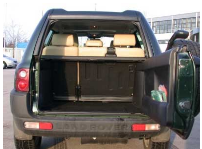
Mit 355 l Volumen bietet der Freelander relativ viel Platz.

+ Das kastenförmigen Format der Karosserie sorgt dafür, dass sich auch sperrige Gegenstände gut verstauen lassen.