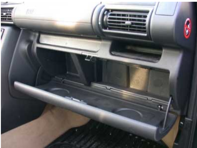
Für eine sinnvolle Nutzung ist das Handschuhfach einfach zu klein.