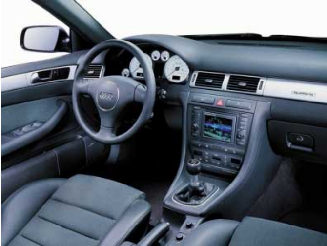
Die Bedienung des A6 ist einfach und funktionell, die Verarbeitung beispielhaft.