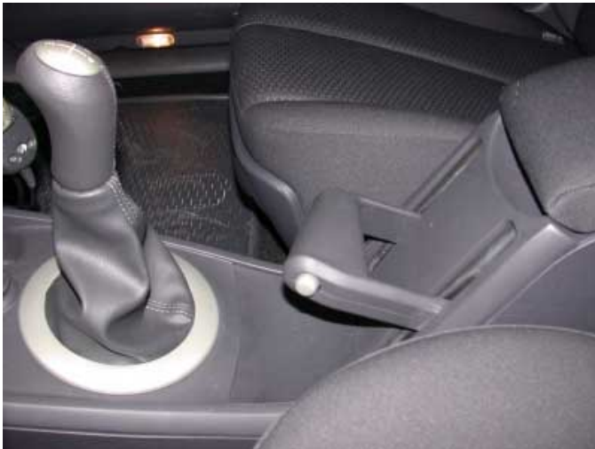
Ein nettes Gimmick: Der Handbremsbügel des Megane.