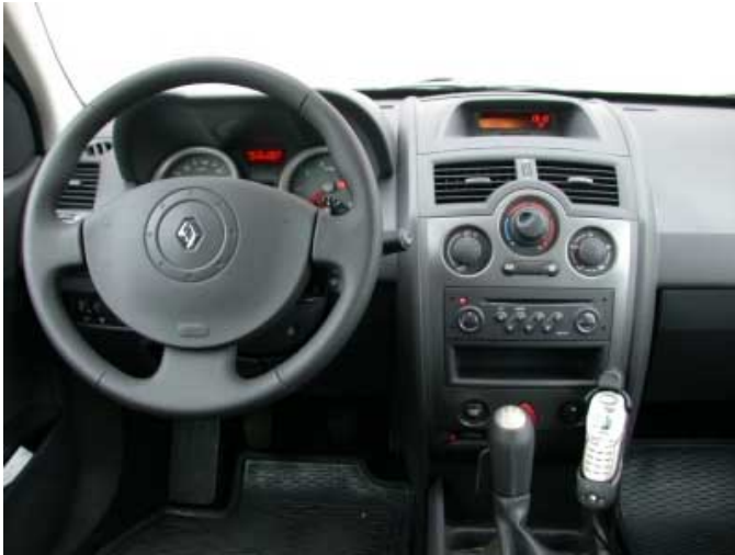
Das Cockpit des neuen Renault Megane beweist, daß sich Funktionalität und außergewöhnliches Design nicht zwangsläufig ausschließen.