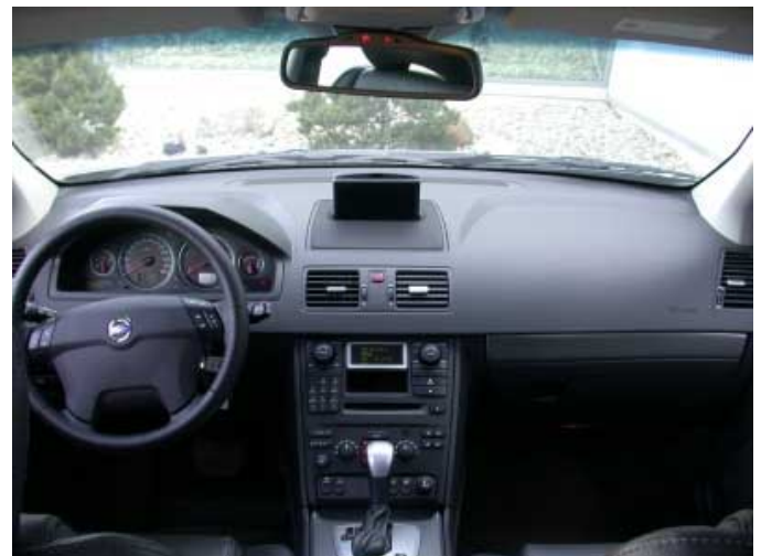
Die Fahrerplatzgestaltung ist geprägt von einer kühlen Funktionalität.