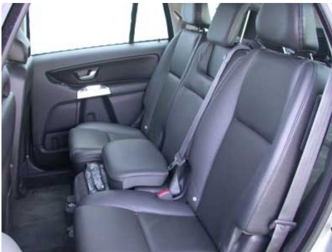
Vorbildlich: Ein integrierter Sitzerhöher ist beim getesteten XC90 Serie.

Diesel auf 100 km. Der Durchschnittsverbrauch liegt bei 9,6 l auf 100 km.