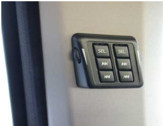
Über eine separate Bedieneinheit können auch die hinten Sitzenden die Audioanlage steuern.