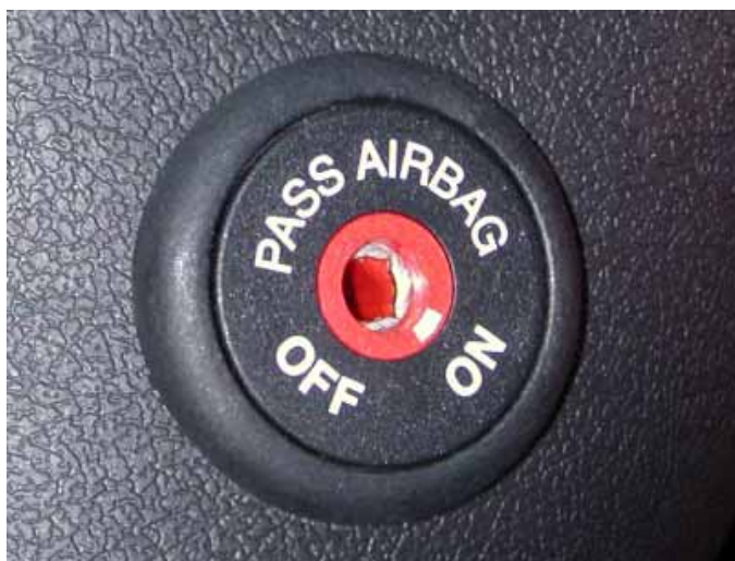
Der Beifahrerairbag lässt sich per Zündschlüssel deaktivieren. Damit können auch auf diesem Sitzplatz rückwärtsgerichtete Kinderrückhaltesysteme verwendet werden.