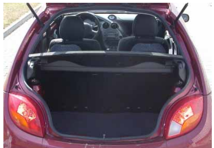
Mit 180 l Volumen ist der Kofferraum des Ka ausreichend groß.