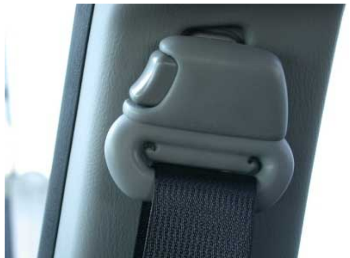
Die harten, vorstehenden Gurtumlenbeschläge erhöhen die Verletzungsgefahr bei einem Seitenaufprall.