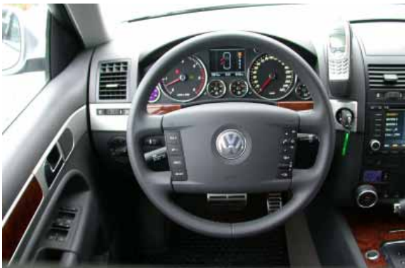
Die Bedienung ist einfach und funktionell, die Verarbeitung und Materialanmutung auf hohem Niveau.