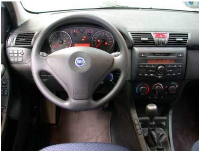
Bis auf wenige Detaillösungen ist der Stilo einfach und funktionell zu bedienen.