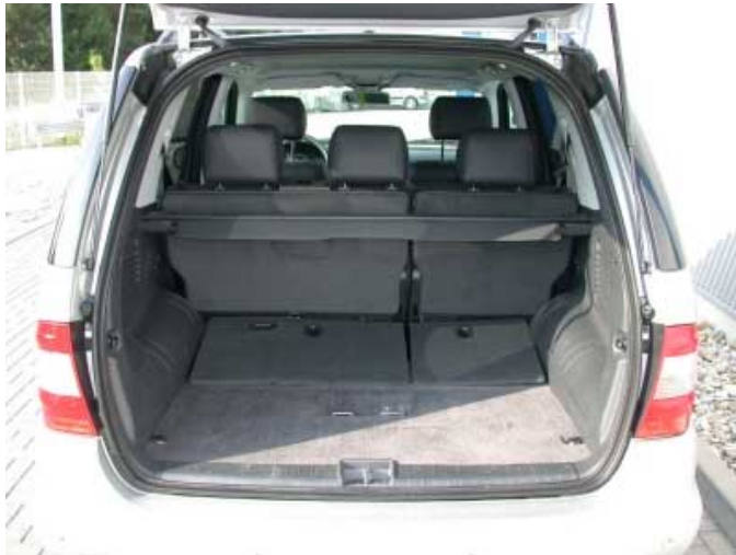
Mit 515 l bietet der Kofferraum des ML etwa 100 l mehr Volumen als der eines BMW X5.