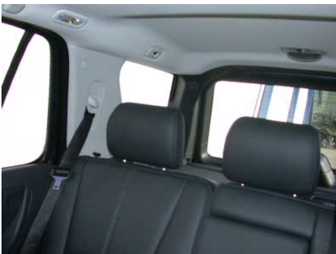
Die nicht versenkbaren hinteren Kopfstützen und die breiten C-Säulen behindern die Sicht nach hinten.