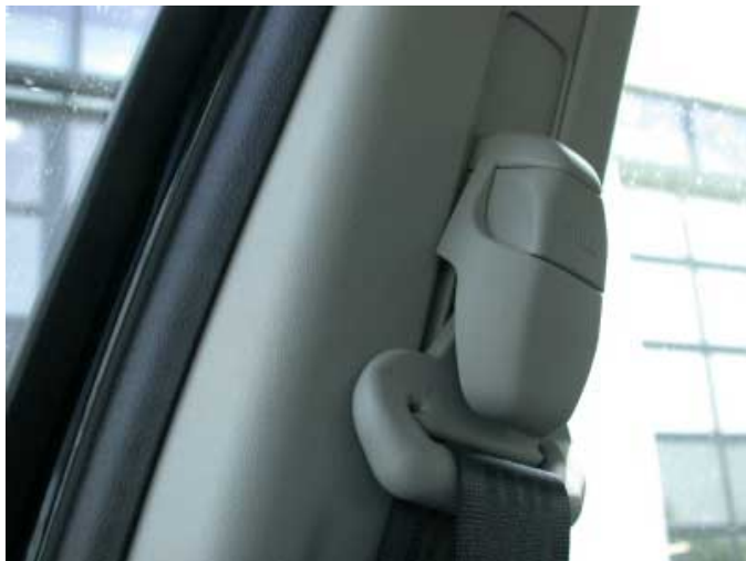
Hervorstehende Gurtbeschläge bedeuten ein erhöhtes Verletzungsrisiko bei einem Seitenaufprall.