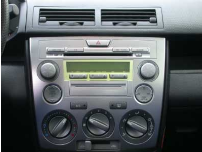
Die Kennzeichnung der Bedienelemente an der Mittelkonsole ist z.T. schlecht erkennbar. Hier könnte man ohne großen Aufwand eine Verbesserung erzielen.