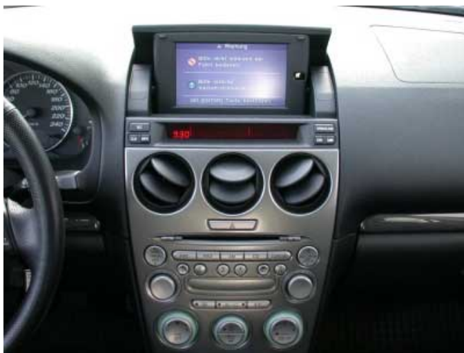
Licht und Schatten beim Navigationssystem. Während der Monitor gut sichtbar angebracht wurde, ist die Bedienung kompliziert.