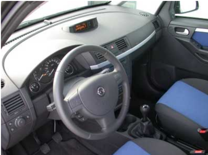
Bis auf die Betätigung der Heizungs- und Lüftungseinsteller ist die Bedienung funktionell.