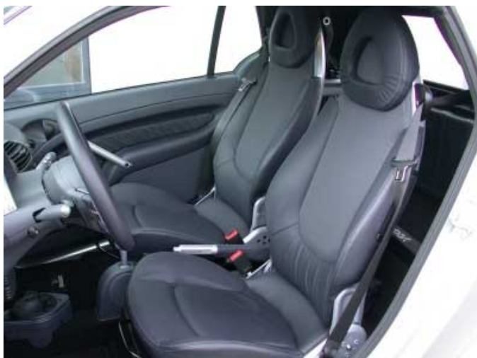
In der Brabus-Version sitzt man auf bequemen, guten Seitenhalt bietenden Sportsitzen.