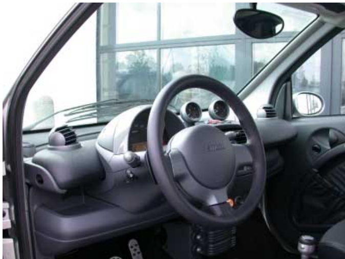
Wie von den anderen Smart-Modellen bekannt ist die Bedienung einfach und funktionell.