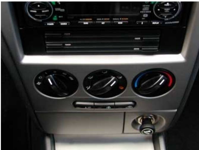
Wie auch bei vielen Klassenkonkurrenten sind die Einsteller für Heizung und Lüftung zu tief positioniert.